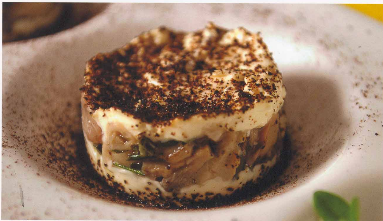
Tiramissu de cogumelos com areia de funghi Ghee Banqueteria 11 3208-0767 (ghee.com.br)

“Tudo deve ser feito de acordo com o gosto e as necessidades de cada cliente, mas é interessante oferecer pratos que acompanhem a estação do ano, com opções de saladas e uma massa que agrade a todos, incluindo vegetarianos”