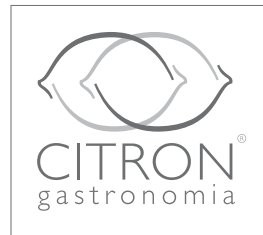
Aplicação gray scale