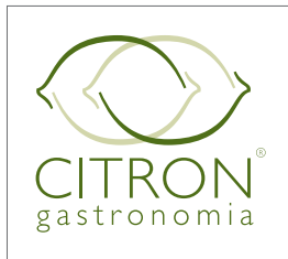
Aplicação 2 cores