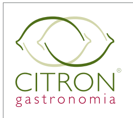
Original 3 cores